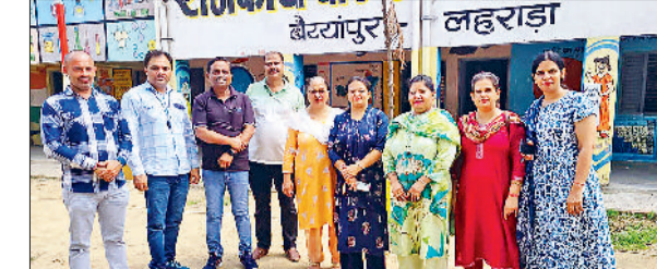
सोनीपत। रैली का न्योता देने के लिए पहुंचे समिति के पदाधिकारी।