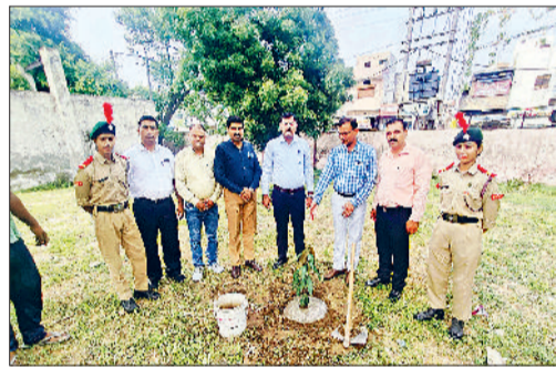
कार्यक्रम के दौरान पौधारोपण करते संस्थान के प्राचार्य एवं अन्य।