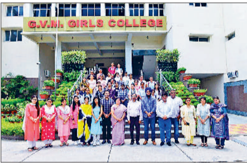
सोनीपत। कार्यशाला शामिल प्रतिभागी, वक्तव्य के साथ कॉलेज प्राचार्य।