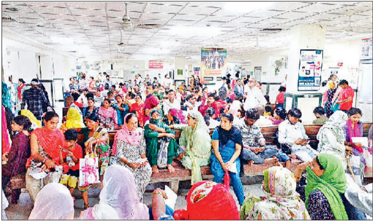
सोनीपत। नागरिक अस्पताल में ओपीडी के बाहर लगी मरीजों की भीड़।