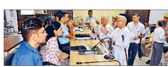
कार्य करें। उन्होंने बताया कि समाधान शिविर के प्रति नागरिकों का रुझान काफी बढ़ रहा है। हर रोज नागरिक शिकायतें लेकर समाधान शिविर में पहुंच रहे हैं। उपायुक्त ने नागरिकों से आह्वान किया कि समाधान शिविर में नागरिक अपनी शिकायतें लेकर

लघु सचिवालय में सोमवार को आयोजित हुए समाधान शिविर में 163 नागरिक शिकायत लेकर पहुंचे, जिनमें से उपायुक्त डॉ. मनोज कुमार ने 5 शिकायतों का मौके पर समाधान किया और शेष 158 शिकायतों के संदर्भ में संबंधित अधिकारियों को नदिश दिए कि वे जल्द इन समस्याओं का समाधान कर लोगों को राहत पहुंचाने का