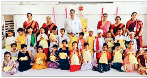
प्रतियोगिता में वेशभूषाओं में सजे प्रतिभागी अपने गुरुजनों के साथ।