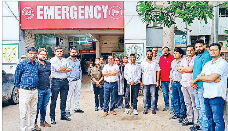
सोनीपत। मांगों को लेकर विरोध जताते चिकित्सक।